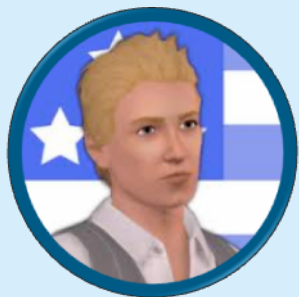
Flintheart Balthazar Halotime Actuel Président