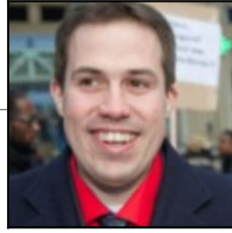
Laurent Louis Député belge conspirationniste en lien avec le Parti Antisioniste .