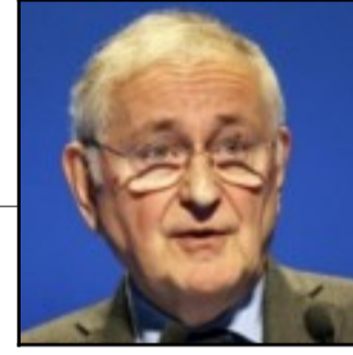
Jacques Cheminade Dirigeant du mouvement conspirationniste et sectaire Solidarité & Progrès