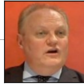
François Asselineau président du parti souverainiste, réactionnaire et complotiste UPR

Par Etienne, jeudi 20 septembre 2012 à 19:02 - Signes de vie d'une Europe des cités Deux tables rondes, une sur la prétendue >crise< (coup d'État bancaire, en fait) et une autre sur la prétendue >démocratie< (injuste ploutoc avec François Asselineau, pour l'Université de l'UPR, au sud du lac d'Annecy,