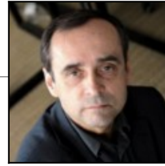
Robert Ménard Journaliste Islamophobe fondateur du site Boulevard Voltaire

Etienne Chouard ROBERT MÉNARD : "LES JOURNALISTES [ACTUELS] SONT LES PIRES ENNEMIS DE LA LIBERTÉ D'EXPRESSION" Un entretien passionnant. Je trouve Robert Ménard très convaincant, sur ce coup-là : c'est L'ISÉGORIA qu'il défend à âprement, ce pilier essentiel qui FONDE ET PROTÈGE toute démocratie digne de ce nom : le droit de parole publique pour tous, à tout moment et à tout propos, pour permettre à chaque citoyen d'être une sentinelle de la démocratie, et pour éclairer l'opinion publique avec une bonne mise en scène des conflits. Ménard est apparemment sur la même position que NOAM CHOMSKY.