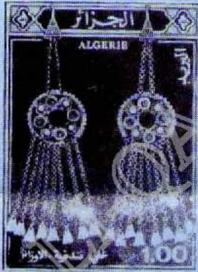
1,00 Parure de tempes

2,90 Fibules Imprimés en Héliogravure 20 timbres à la feuille