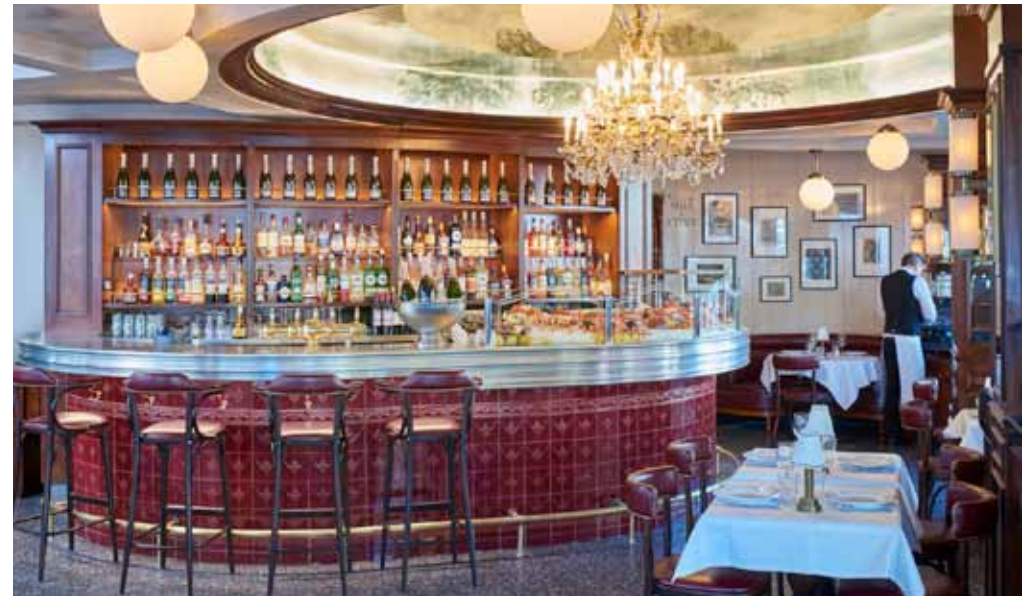
Bar et salle du restaurant

1 SALON PRIVATIF (1 ER ÉTAGE) - 70M 2 PRIVATISABLE