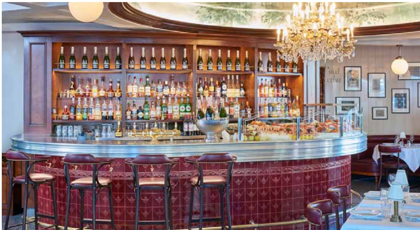
Le bar et son banc d'écailles