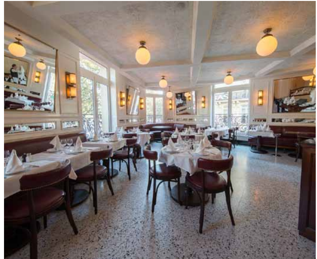
1 er étage du restaurant