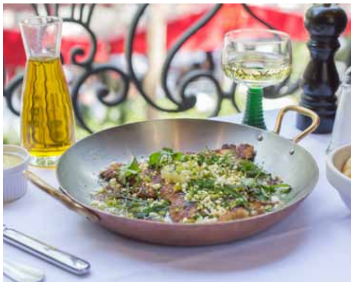
Escalope de veau viennoise