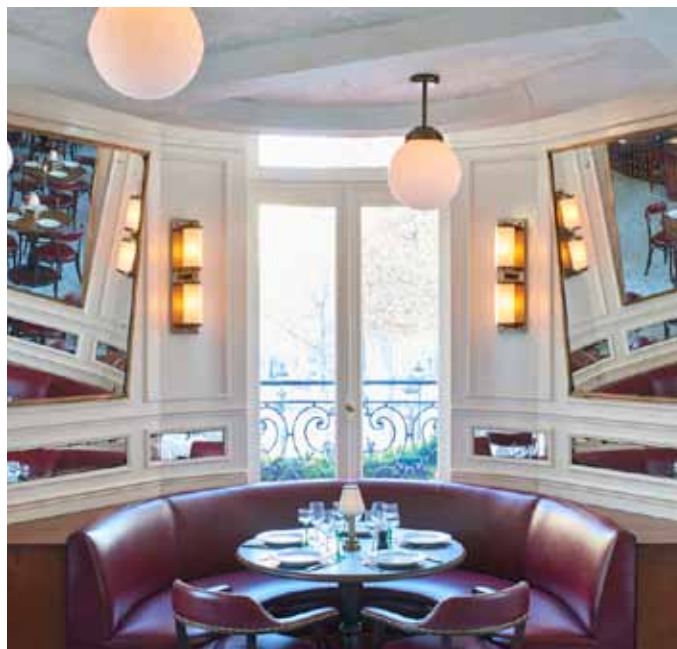
1 er étage