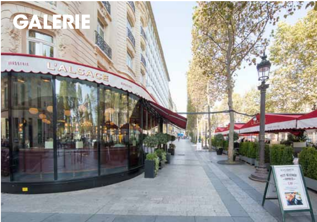
Façade de l'établissement