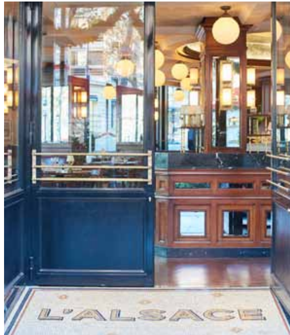
Entrée de l'établissement

1 SALON PRIVATIF (1 ER ÉTAGE) - 70M 2 PRIVATISABLE