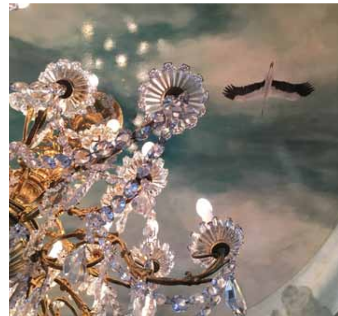
Coupoles et lustre