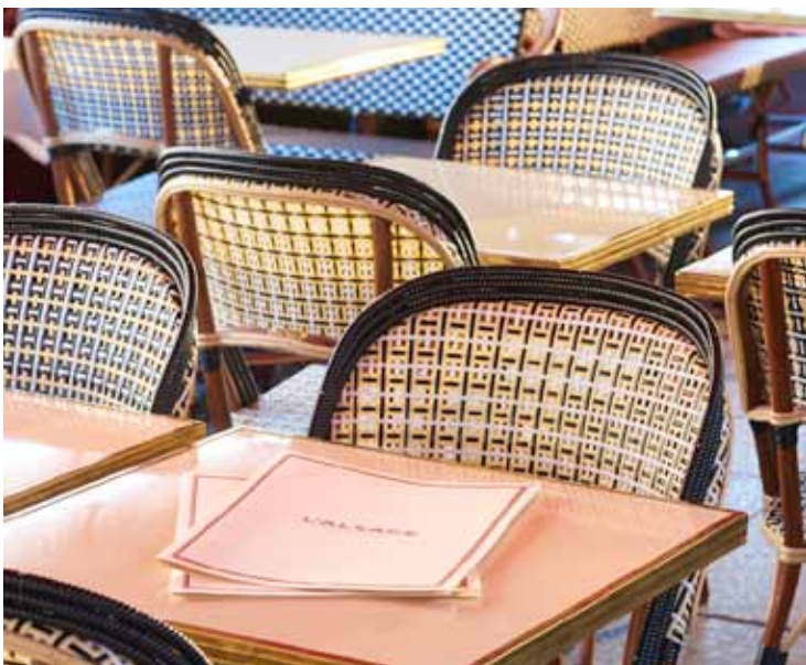
Terrasse de l'établissement