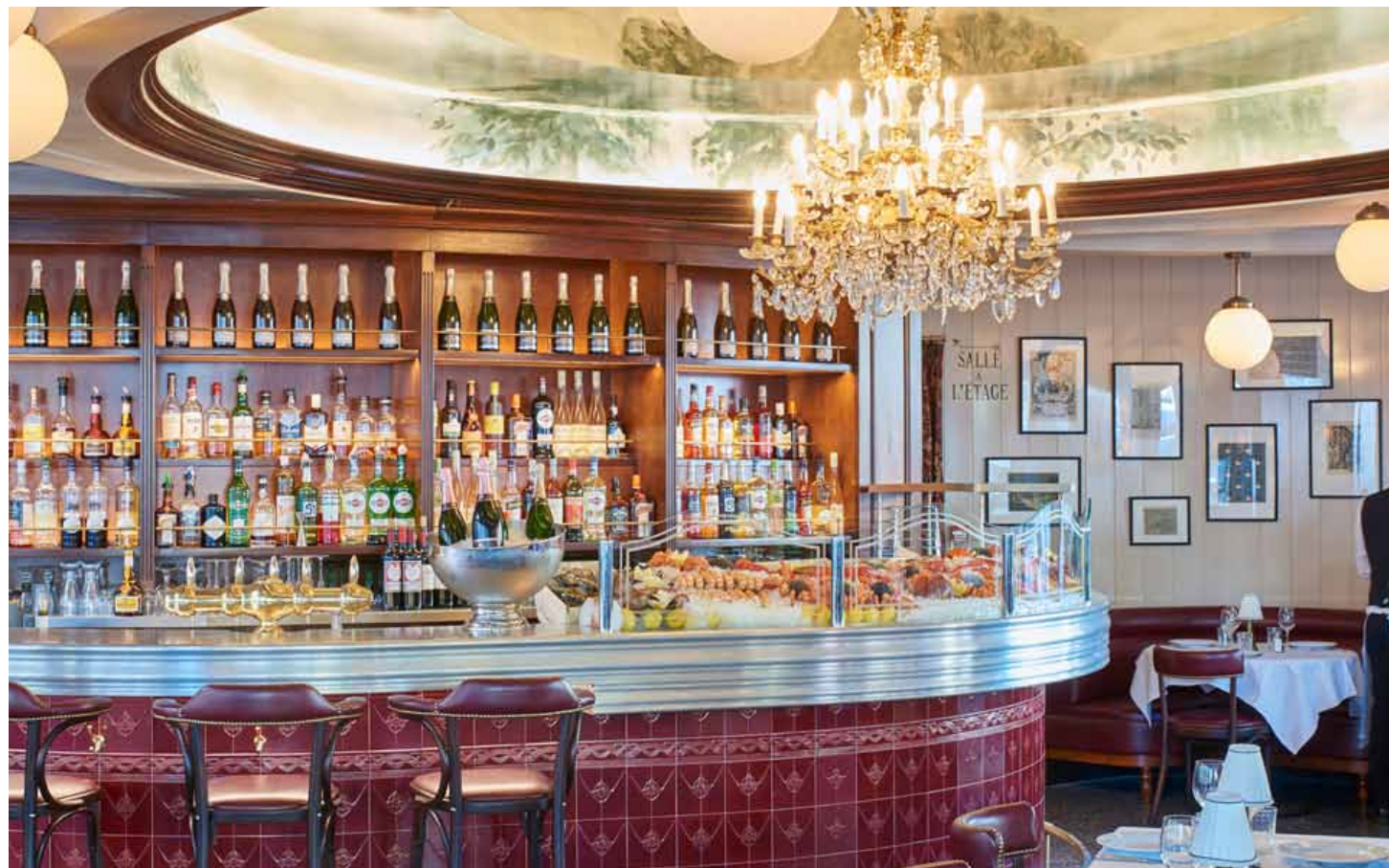
Le bar et son banc d'écailles