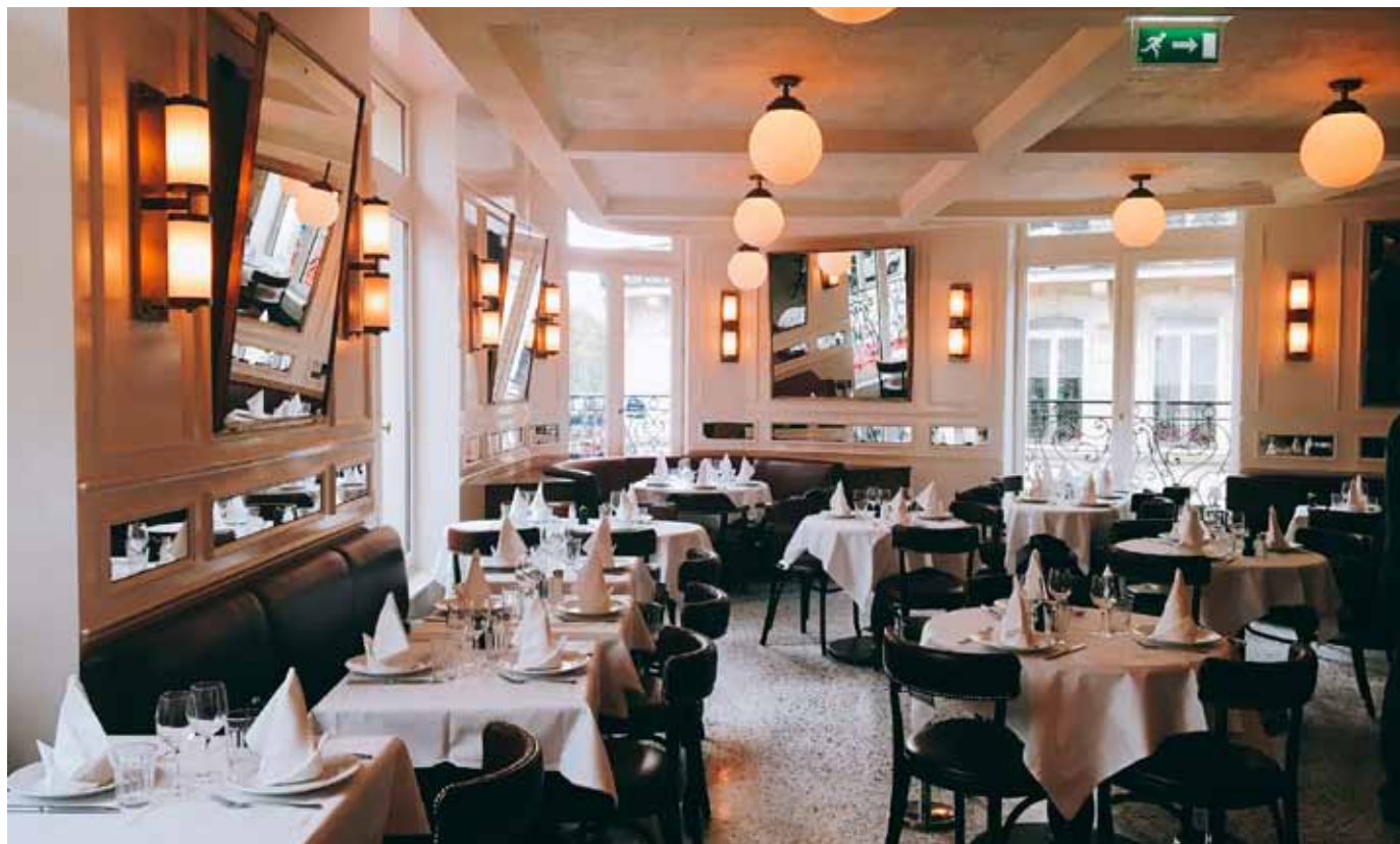
1 er étage du restaurant

Idéalement située sur les Champs-Élysées, la terrasse peut accueillir jusqu'à 100 personnes en repas assis pour vos événements. Cette dernière peut être chauffée.