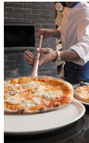
Le four à pizza