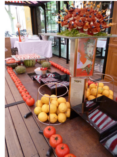
Soirée Apérol Spritz