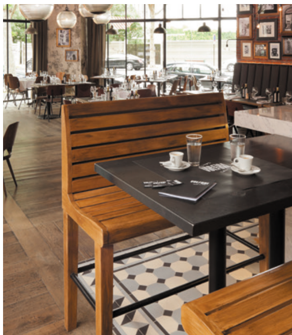
Café au bar