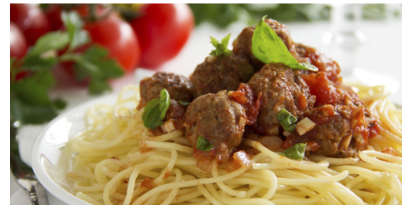
Spaghetti bio all'arrabbiata