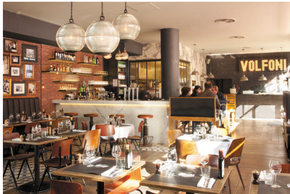
La grande salle