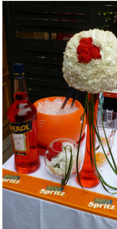
Soirée Apérol Spritz