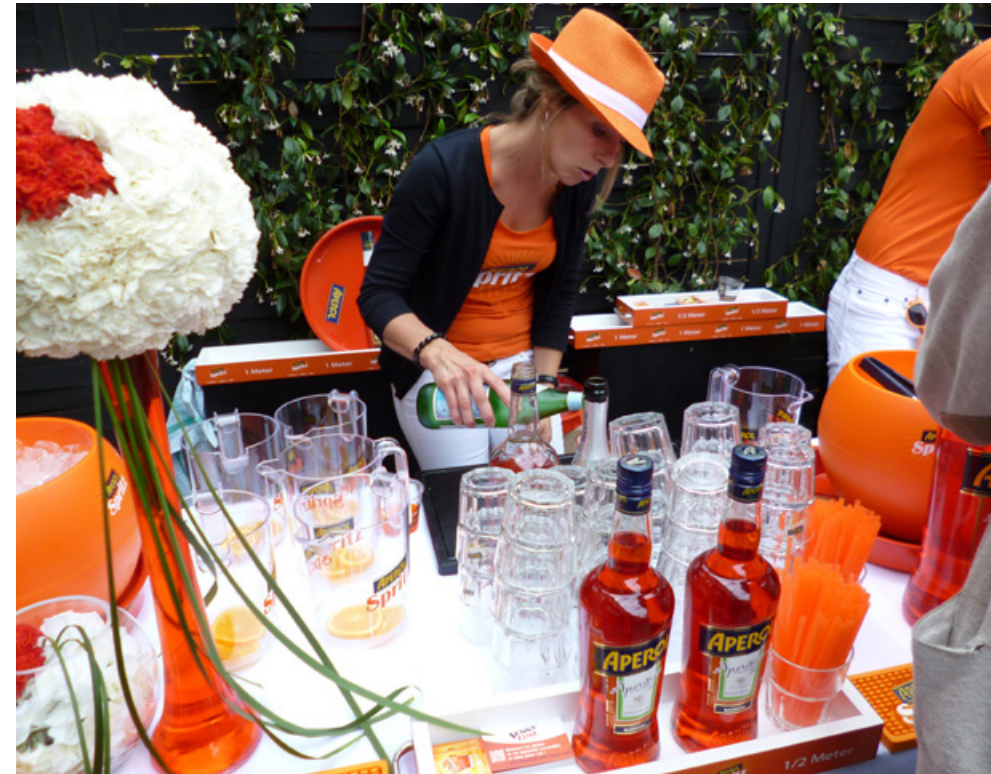
Cocktail Apérol Spritz