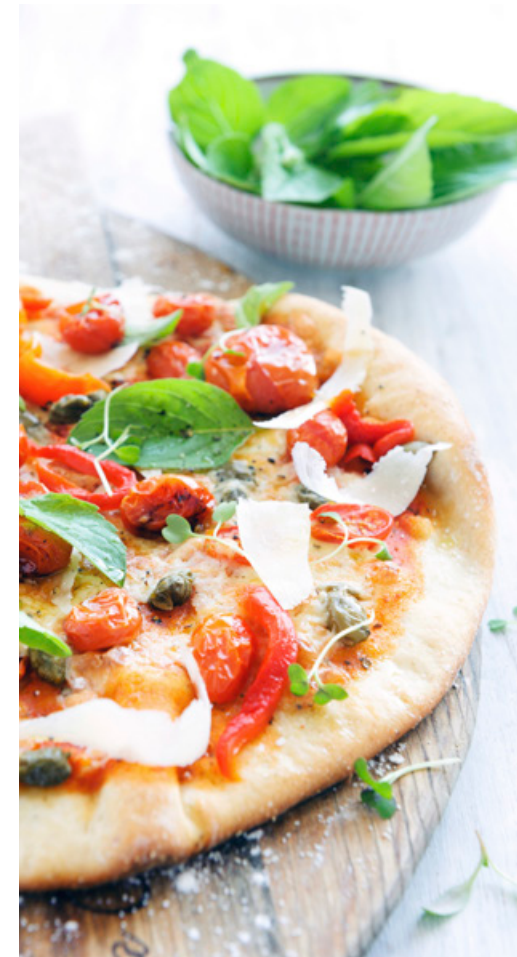
Pizza au feu de bois