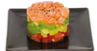
9€50 Tartare saumon, avocat et tomate