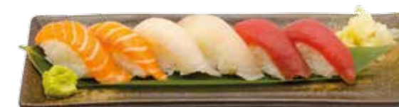
Menu E 16€90 6 sushi: 2 saumon, 2 thon, 2 daurade