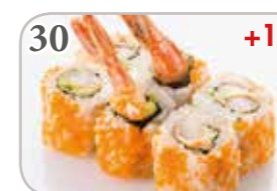
30 Masago roll Int. : tempura crevette (6 pièces) +1€