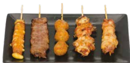
Menu K 11€50

1 boulettes de poulet, 1 poulet, 1 bœuf au fromage, 1 aile de poulet, 1 courgette, 1 champignon, 1 bœuf