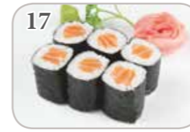
17 Maki saumon (6 pièces)