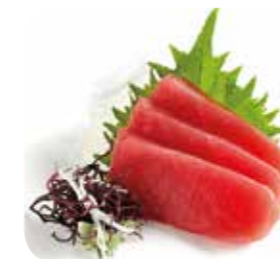
Sa1 9€00€ Thon