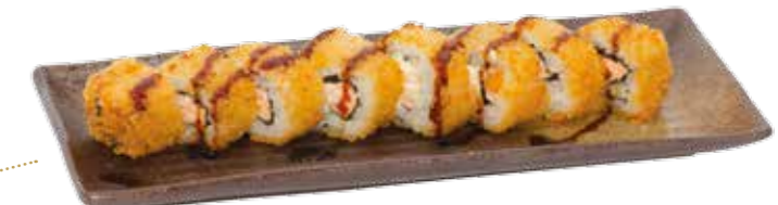
Crousti roll 10€00 Int. : saumon fromage