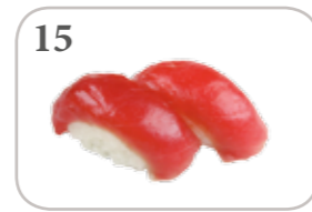
15 Sushi thon (2 pièces)