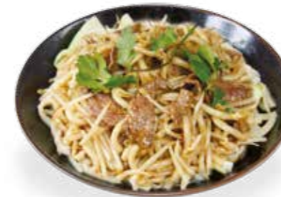
10€00 Nouilles sautées au bœuf