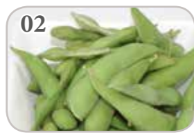
02 Edamame (haricots branches)