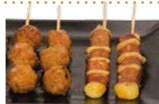
4 brochettes : 2 bœuf au fromage, 2 boulettes de poulet