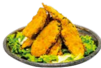
10€00 Tempura aux légumes (8 pièces)