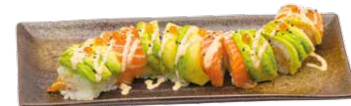
Sun roll 9€50 Int. : tempura crevette saumon