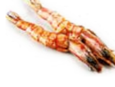
Y16 6€50 Gambas