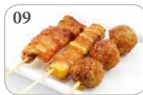
09 3 brochettes (1 poulet, 1 bœuf au fromage, 1 boulettes de poulet)