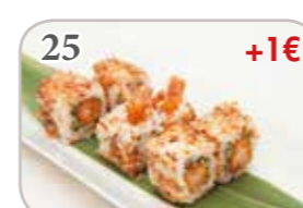
25 Oignon roll tempura crevette (6 pièces) +1€