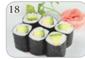
18 Maki avocat (6 pièces)