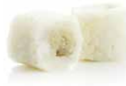
4€60 Thon cuit