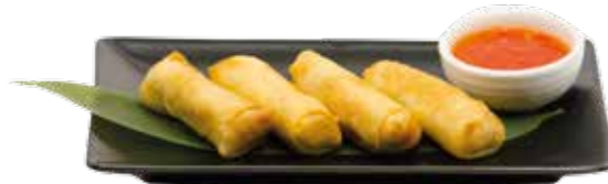
4€50 Nem au poulet (4 pièces)