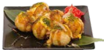
8€00 TAKOYAKI (6 boulettes de poulet)