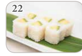
22 Neige roll avocat (6 pièces)