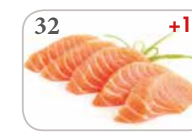
32 Sashimi saumon (5 pièces) +1€