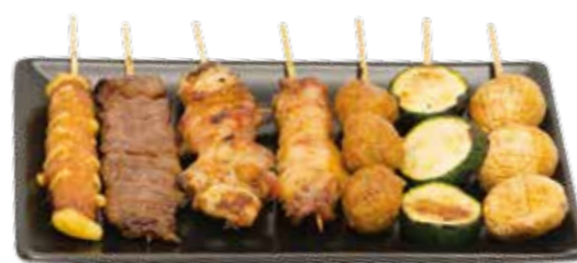
Menu N 15€00

2 courgettes, 2 champignons de Paris, 2 aubergines