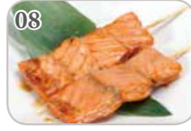
08 2 brochettes (saumon)