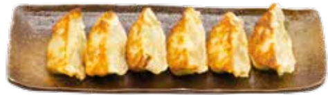
7€00 Gyoza (6 raviolis au poulet)