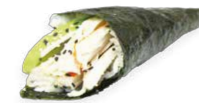
4€50 Avocat surimi