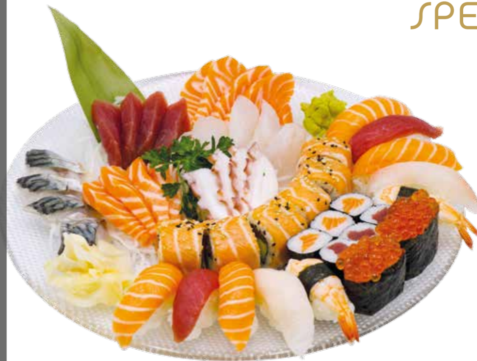
Menu VALENTIN (A) 54€90

(pour 2 personnes) 2 soupe, 2 salades et 2 riz nature 24 sashimi, 12 sushi, 6 maki, 6 Las Vegas maki