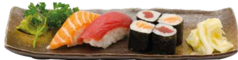
MD3 9€90 4 sushi (2 saumon, 2 thon) 4 maki (2 saumon, 2 thon)