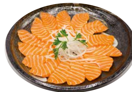
Shake Carpaccio-saumon (vinaigrette "yuzu") 16€00