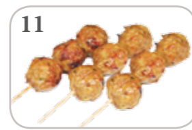
11 3 brochettes (boulettes de poulet)