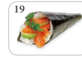
19 Temaki saumon avocat (1 pièce)