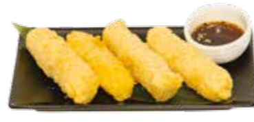
8€00 Tempura fromage (4 pièces)