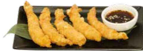
10€00 Tempura aux crevettes: (5 pièces)