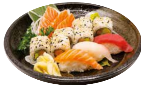
Menu T 18€90 6 California, 3 sushi, 3 sashimi