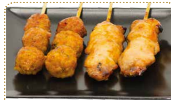
MD1 7€90 4 brochettes viandes au choix: 1 boulettes de poulet, 1 poulet, 1 aile de poulet, 1 bœuf

servis avec 1 soupe, 1 salade et 1 riz nature