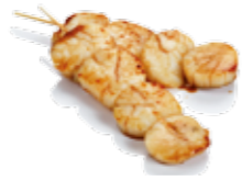
Y15 6€50 Noix de St-Jacques