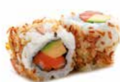
5€50 Saumon avocat