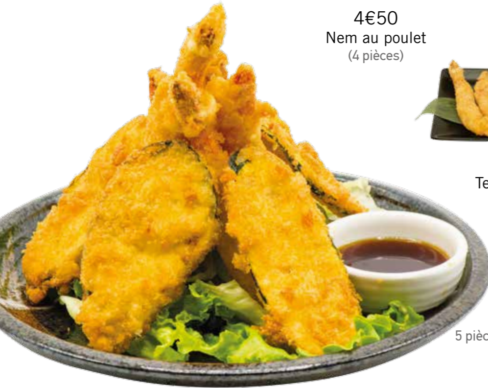
15€00 Tempura mixte: 5 pièces de crevettes et légumes