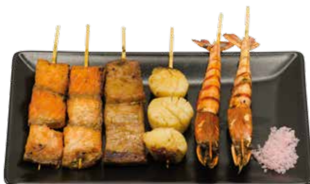
Menu O 16€90

1 boulettes de poulet, 1 poulet, 1 bœuf au fromage, 1 aile de poulet, 1 champignon, 1 bœuf