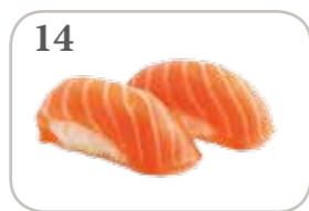
14 Sushi saumon (2 pièces)