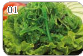
01 Salade wakamé (salade d'algue)