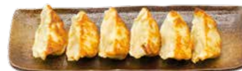
Gyoza (6 raviolis au poulet)