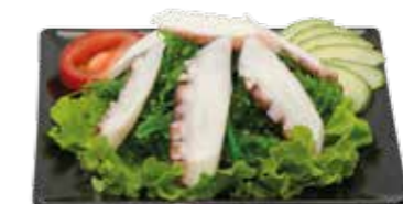
10€00 Salade au poulpe et algue 10€00 Salade verte aux fruits de mer