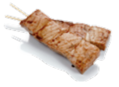
Y12 4€00 Thon