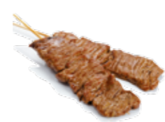
Y8 4€00 Bœuf