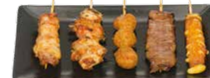
5 brochettes: 1 boulettes de poulet, 1 poulet, 1 bœuf, 1 bœuf au fromage, 1 aile de poulet