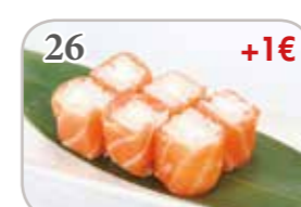
26 Saumon roll cheese (6 pièces) +1€