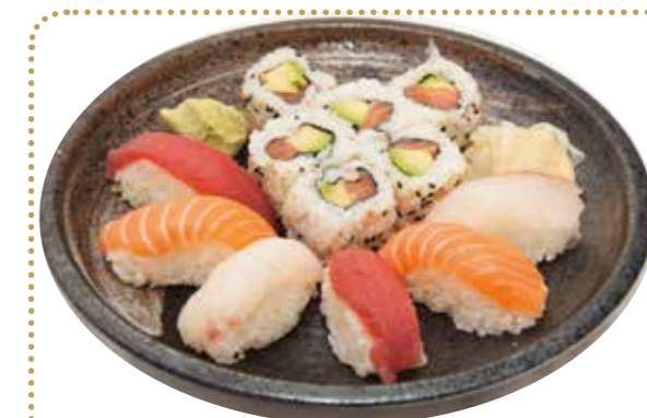
MD12 13€90 6 California saumon avocat 6 sushi (2 saumon, 2 thon, 2 daurade)