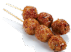
Y4 4€00 Boulettes de poulet