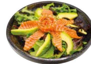
10€00 Salade de saumon avocat