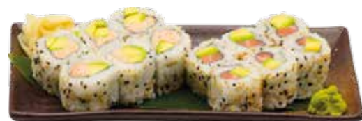
MD15 12€90 6 California saumon avocat 6 California thon cuit avocat