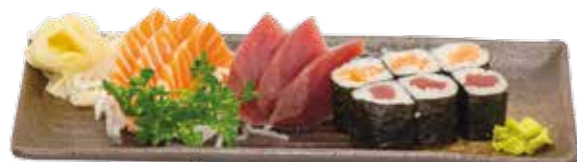
MD7 9€50 6 maki (3 saumon, 3 thon) 6 sashimi (3 saumon, 3 thon)