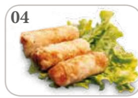
04 Nem au poulet (3 pièces)