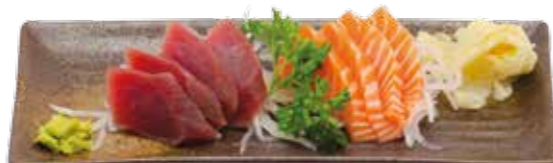
MD2 9€50 8 sashimi : 4 saumon, 4 thon