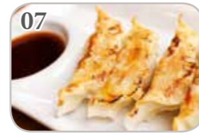
07 Raviolis grillés au poulet (3 pièces)