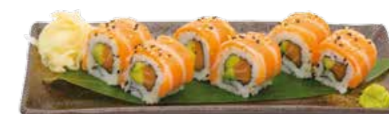
Menu D 16€90 6 Las Vegas