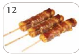
12 3 brochettes (bœuf au fromage)