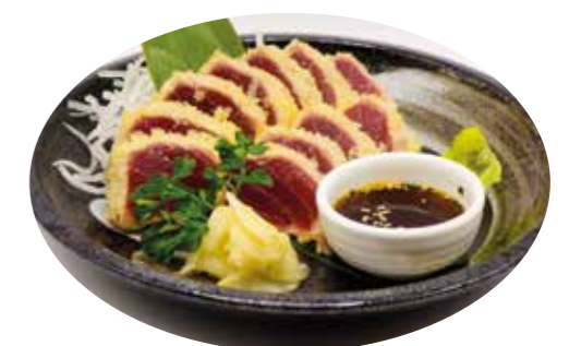
Menu SP4 16€90 Thon mi-cuit (10 pièces)