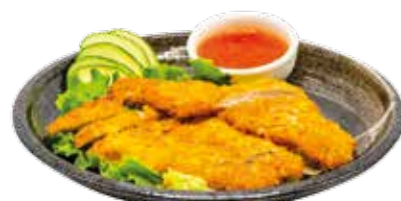
13€50 Menu poulet pané (1 soupe, 1 salade et 1 riz)