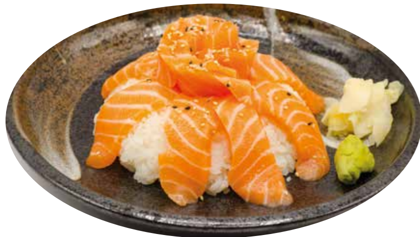
MD5 11€50 Chirachi saumon Saumon cru sur riz vinaigré

servis avec 1 soupe, 1 salade et 1 riz nature