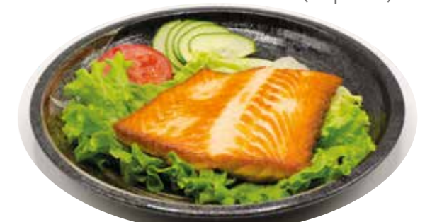
16€00 Saumon grillé sauce MIRIN