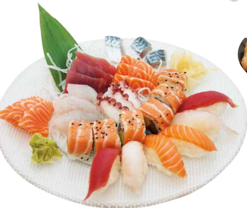
Menu VALENTIN (B) 49€90

(pour 2 personnes) 2 soupe, 2 salades et 2 riz nature 18 sashimi, 6 sushi, 6 Las Vegas, 6 brochettes : 2 boulettes de poulet, 2 bœuf au fromage, 2 poulet