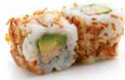
5€50 Thon cuit avocat