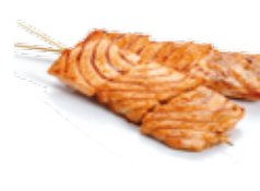
Y11 4€00 Saumon