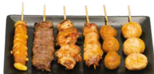
Menu L 13€00

1 boulettes de poulet, 1 poulet, 1 bœuf, 1 bœuf au fromage, 1 aile de poulet