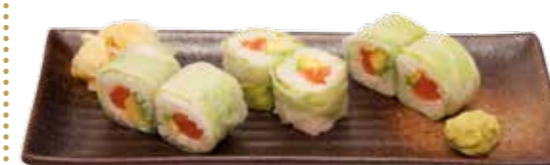
Menu R 16€90 6 maki printemps rolls (au choix)