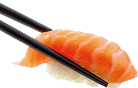
Su1 4€50 Saumon