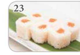
23 Neige roll saumon (6 pièces)