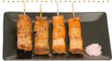
4 brochettes : 2 saumon, 2 thon