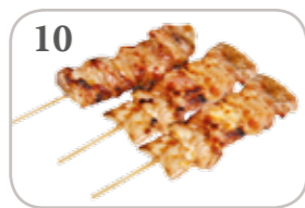
10 3 brochettes (poulet)