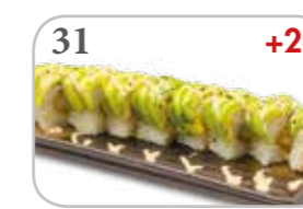
31 Avocat roll Int. : tempura crevette (8 pièces) +2€