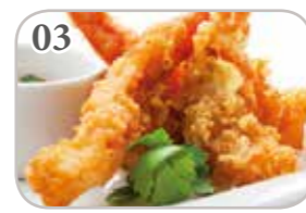
03 Tempura crevettes (3 pièces)