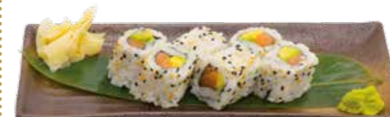
Menu H 16€90 6 maki California (au choix)