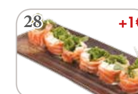
28 Fresh rolls roquette (6 pièces) +1€