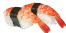
Su3 5€00 Crevette