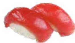
Su2 4€50 Thon