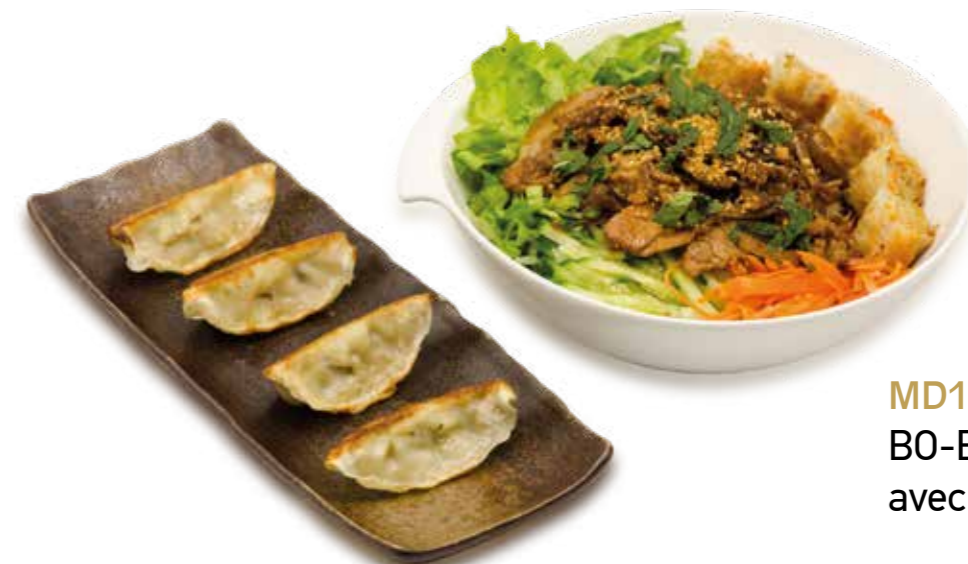
MD14 12€90 BO-BUN avec 4 gyoza