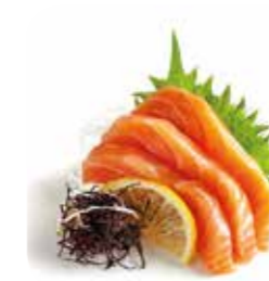
Sa2 9€00 Saumon