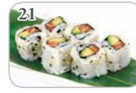
21 California saumon avocat (6 pièces)