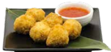
7€00 Tempura aux boulettes de poulet (6 boulettes de poulet)