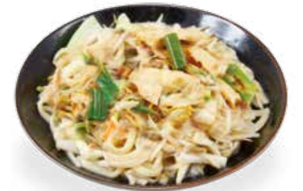
10€00 Nouilles sautées au poulet