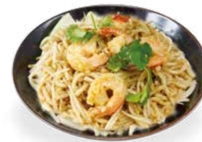
10€00 Nouilles sautées aux fruits de mer