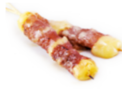
Y9 4€00 Bœuf au fromage