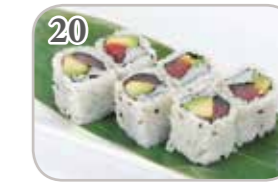
20 California thon avocat (6 pièces)