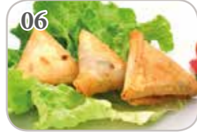
06 Samoussa au poulet (3 pièces)