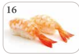
16 Sushi crevette (2 pièces)