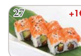
27 Las Vegas (6 pièces) +1€