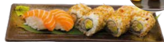
MD9 10€90 6 California oignons frits thon cuit, 2 sushi saumon, 3 brochettes: 1 bœuf au fromage, 1 poulet, 1 boulettes de poulet