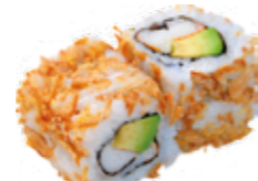
5€50 Surimi avocat

Concombre ..... 5€50 Cheese saumon ..... 5€50