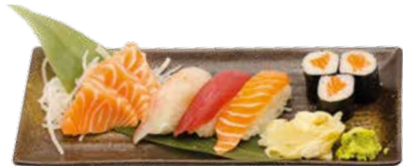
Menu G 16€90 3 maki, 3 sushi, 3 sashimi