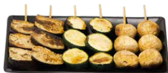
Menu V 11€50

servis avec 1 soupe, 1 salade et 1 riz nature