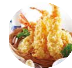
3 tempura crevettes