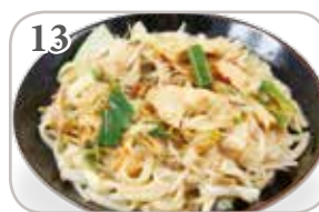
13 Nouilles sautées au poulet