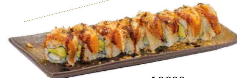
Anguille roll 12€00 Int. : crevette avocat