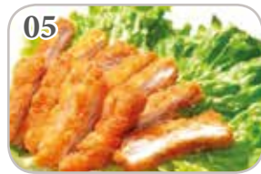
05 Poulet pané