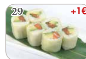
29 Printemps roll saumon avocat (6 pièces) +1€