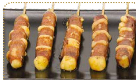
MD11 11€50 5 brochettes bœuf au fromage