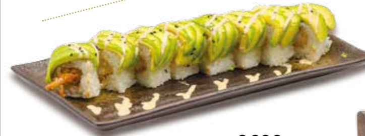
Avocat roll 9€00 Int. : tempura crevette