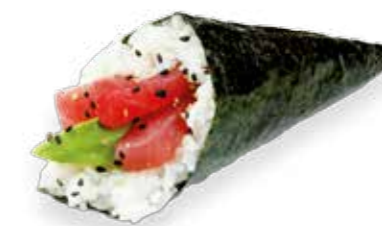
4€50 Thon avocat