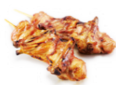
Y6 4€00 Aileron de poulet