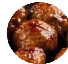
3 boulettes de poulet