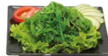
5€00 Salade wakamé (Salade d'algue)