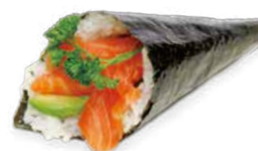
4€50 Saumon avocat