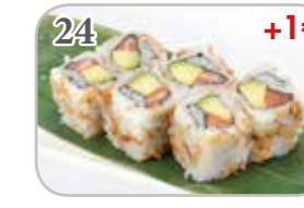
24 Oignon roll saumon avocat (6 pièces) +1€