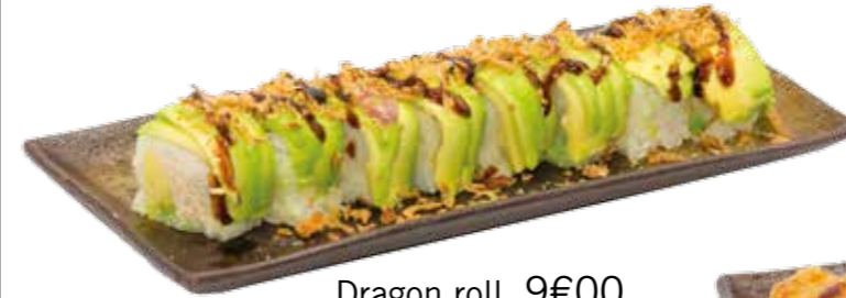
Dragon roll 9€00 Int. : thon cuit mayonnaise