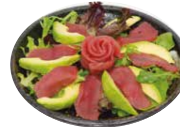
12€00 Salade de thon avocat