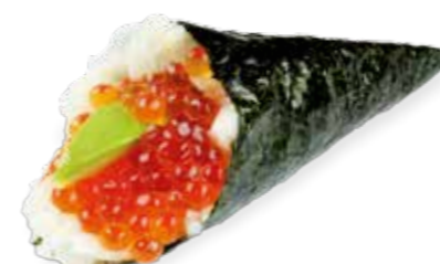
4€50 Œufs de saumon avocat