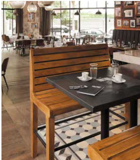
Café au bar

150M 2 AUX PORTES DE PARIS - UNE TERRASSE CHAUFFÉE