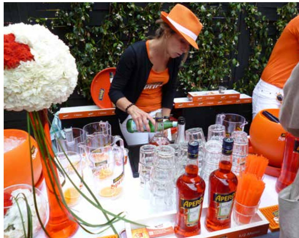
Cocktail Apérol Spritz