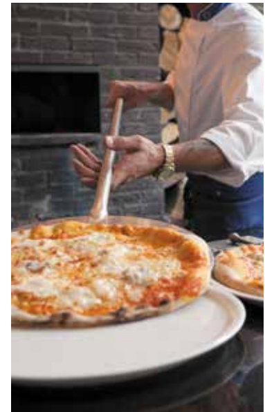
Le four à pizza