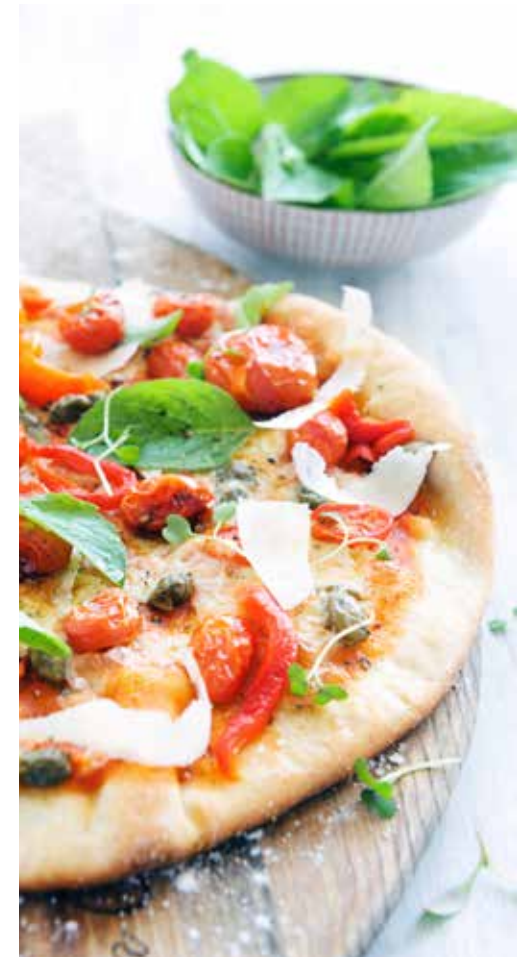
Pizza au feu de bois