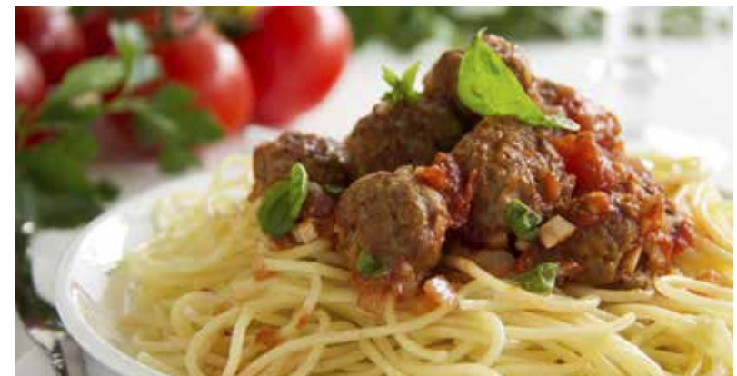
Spaghetti bio all'arrabbiata