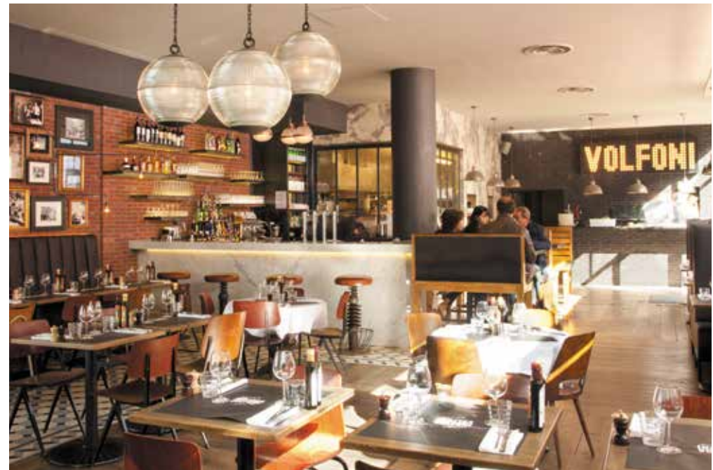
La grande salle