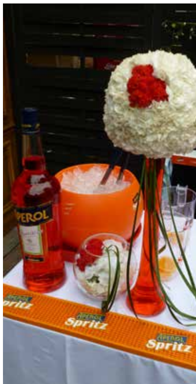
Soirée Apérol Spritz