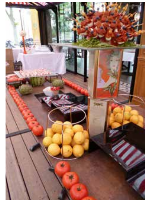
Soirée Apérol Spritz