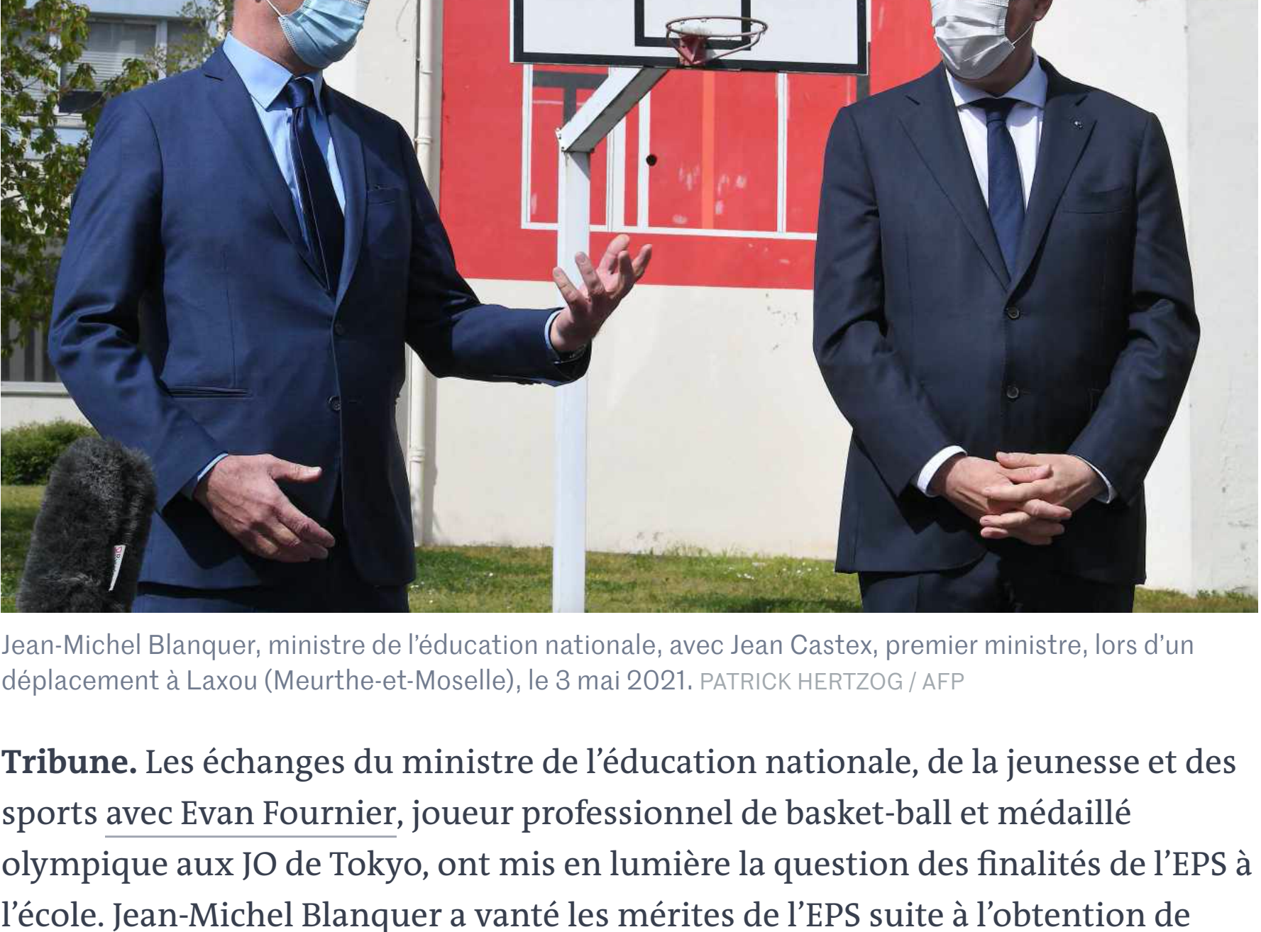
Jean-Michel Blanquer, ministre de l'éducation nationale, avec Jean Castex, premier ministre, lors d'un déplacement à Laxou (Meurthe-et-Moselle), le 3 mai 2021.

Tribune. Les échanges du ministre de l'éducation nationale, de la jeunesse et des sports avec Evan Fournier, joueur professionnel de basket-ball et médaillé olympique aux JO de Tokyo, ont mis en lumière la question des finalités de l'EPS à l'école. Jean-Michel Blanquer a vanté les mérites de l'EPS suite à l'obtention de médailles en sports collectifs, tandis que le basketteur a expliqué, a contrario, que l'EPS n'avait joué aucun rôle dans sa réussite de sportif de haut niveau. Ces deux visions nous semblent réductrices au regard des enjeux réels portés par cette discipline scolaire.